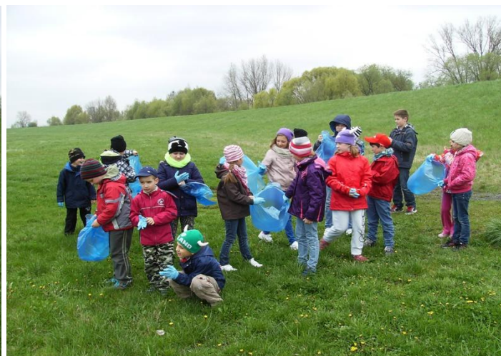
Udział w Tygodniu Czystości Wód - akcja sprzątania terenów łowiska nad Kanąłem Ulgi w Opolu

Realizując podczas zajęć teoretycznych tematykę ochrony wody opieramy się na „Karcie Rzeczników Wody”, która została opracowana podczas Międzynarodowego Spotkania Rzeczników Wody zorganizowanego przez Franciski Komitet UNESCO. Główny nacisk kładziemy na Art. 3: „Wodę należy dzielić pomiędzy wszystkie istoty żywe (ludzi, zwierzęta, rośliny...), ponieważ nie jest ona jedynie własnością człowieka” - tak rozumiemy „Wodę dla Życia”.